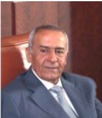
De Heer Mohamed AGREBI, DG BIAT

Gecreëerd in 1976, is de BIAT – Banque Internationale Arabe de Tunisie – heden de eerste bank van het land rekening houdend met de belangrijkste indicatoren. Haar aandeel in de markt is 17 %, zowel voor wat betreft de activiteit als de