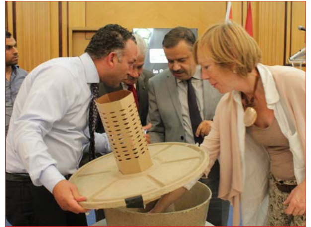
présentation de « Cocoon » à Mr le Ministre