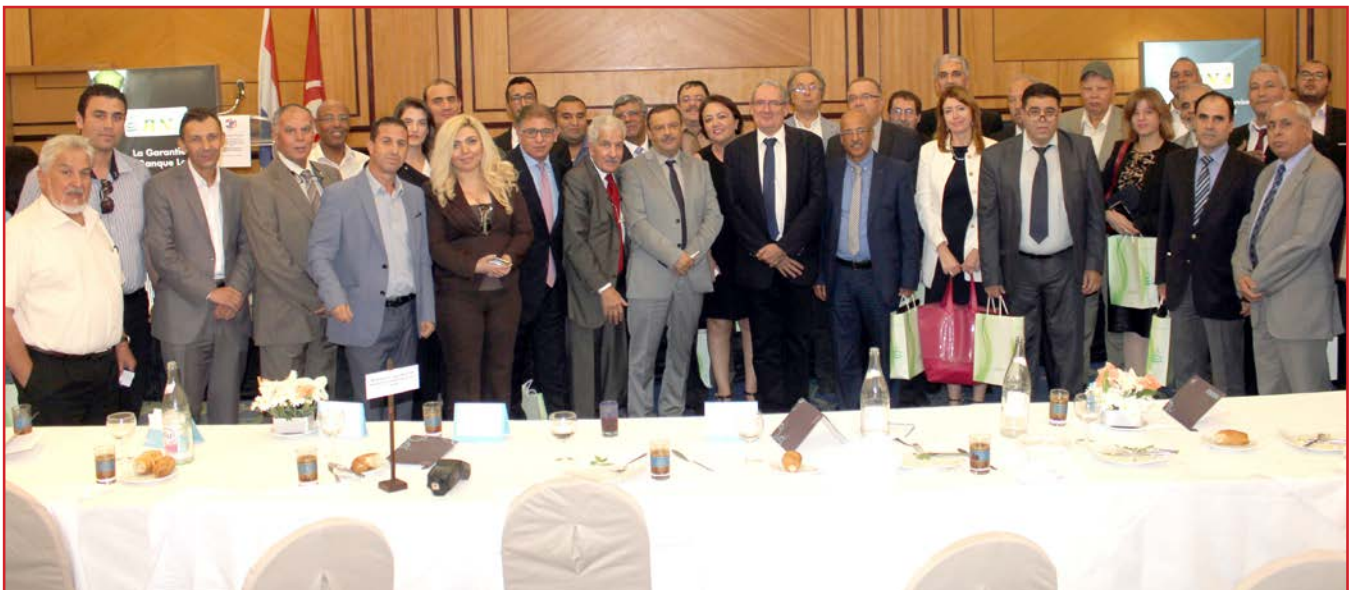
Photo de groupe autour de Mr le Ministre à la clôture de cet événement