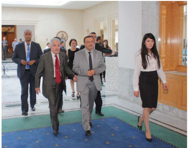
Vers la salle El Majless