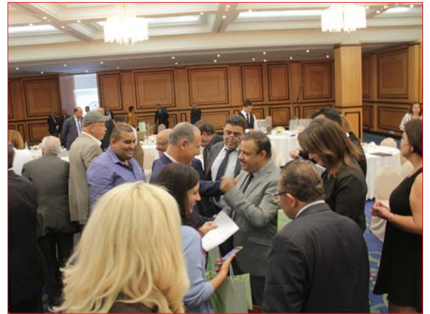
poursuite avec sourires, satisfaction, et joies partagées,