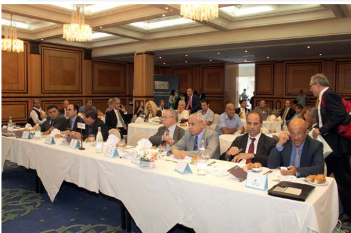
Visiblement, discussions déjà entamées...