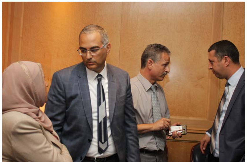
Discussie in duo ...