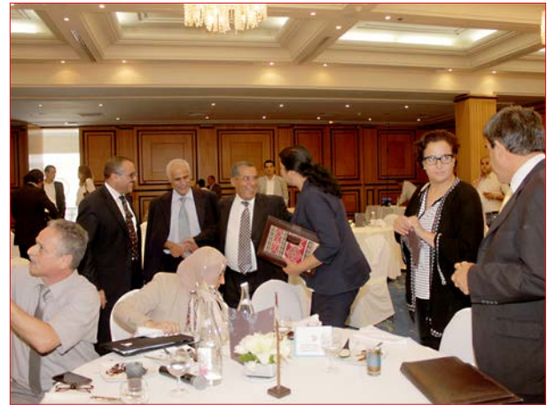
Voortgang met gedeelde glimlachen, tevredenheid en vreugde