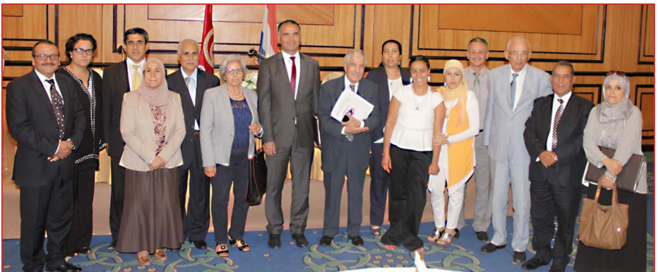
Kaderpersoneel van het Ministerie van Sociale Zaken, van onze Kamer, de Conect, en vriend(en) aan het eind van onze ontmoeting.